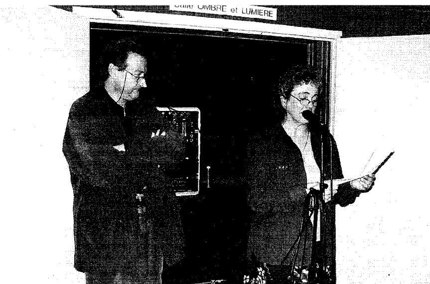
En une centaine de clichés, Daniel Denis rend un hommage poétique aux ostréiculteurs du bassin d'Oléron (Exposition photos Amfreville)

Par ailleurs, il confie que le choix délibéré du noir et blanc lui permet de jouer avec l'ombre et la lumière et de mieux cerner les sentiments : «le noir et blanc a une âme. Le regard du visiteur n'est pas distrait par les couleurs. De plus, il paraît que l'on rêve en noir et blanc...» écrit-il. Ainsi, Daniel Denis s'est déjà exprimé de cette manière, lors d'autres expositions de photos, consacrées aux thèmes du cirque, de la forêt, du patri-